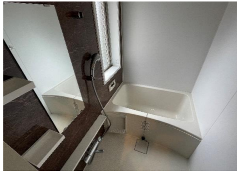
↑1Kタイプの写真です。