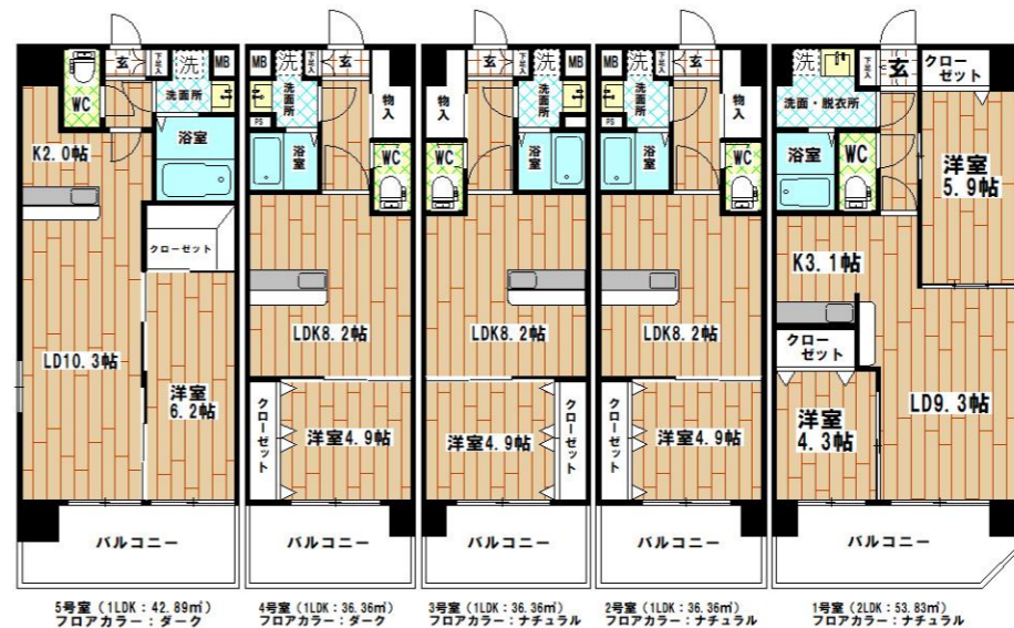
家賃表 単位:円 共益費5,000円